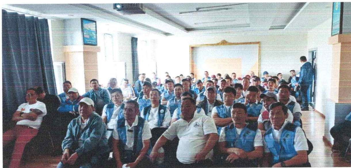
Сургалтын үйл явцаас